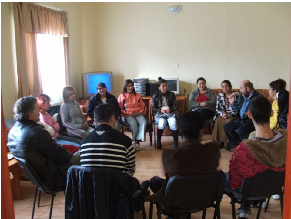
Résztevők a személyiségfejlesztő tréningen

A program célcsoportjai az aktív korú, alacsony foglalkoztatási eséllyel rendelkező nem foglalkoztatott emberek: