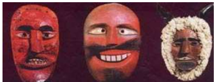
Busómaszkok-Néprajzi Múzeum anyaga

Farsang ünnepéhez kötődik Magyarországon a népi színjátszás kialakulása. A különféle maszkos alakoskodásokból nőttek aztán ki a különféle dramatikus játékok, amelyekben tipikus alakokat személyesítettek meg. Ilyenek voltak a cigány, a betyár, a koldus, a vándorárus, a menyasszony, vőlegény. Kedvelt volt a férfi-női szerep- és ruhacsere. Szívesen alkalmaztak állatmaszkokat is, gyakran feltűnik a játékokban a kecske, a ló, a medve. Már a XVI. századtól vannak adataink az egyik legnépszerűbb alakoskodó játékról, az ún. Cibere vajda - Konc király párviadaláról. Az egyik szereplő a bőjti ételeket (cibere), a másik a húsételt személyesíti meg, az ő viszálykodásukról szól a játék. A legismertebb alakoskodó szokás magyar nyelvterületen a mohácsi busójárás. A délszláv eredetű sokákok faálarcos felvonulásairól már a XIX. századból vannak feljegyzések, bár ezek általában a vigadalom botrányos részleteit emelik ki. Mivel az álarcok a szereplőknek inkognitót biztosítottak, viszonylag gyakran került sor verekedésre, nők molesztálására, ami ellen a felháborodott közvélemény a hatóságok segítségét követelte. A XX. század folyamán aztán ezt az izgalmas ünnepet sikerült mederbe terelni, és ekkor terjedt el a busójárás elnevezés is, a sokákok ezt a farsangot záró eseményt Poklada 'átöltözés, átváltozás' néven említik.