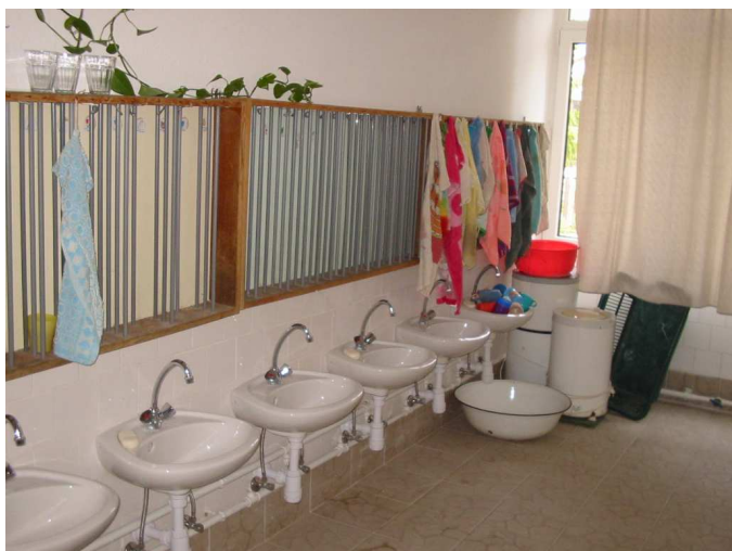
A vizesblokk, csere után