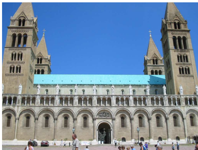
A pécsi Bazilika