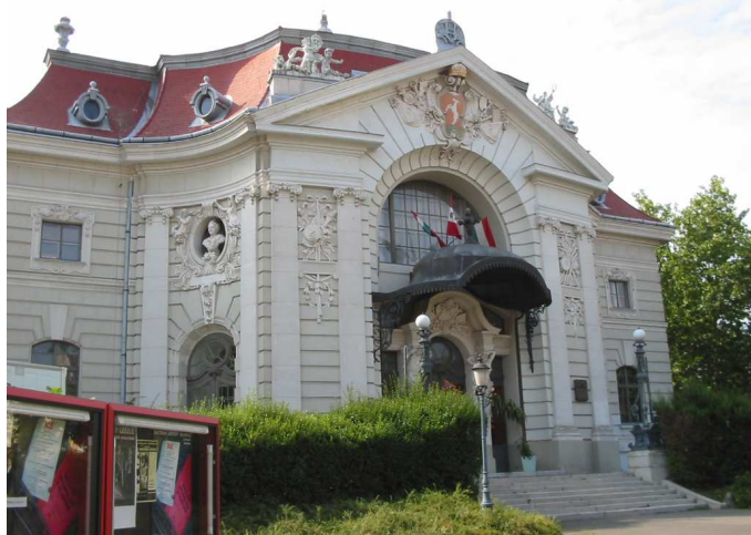
A kecskeméti Katona József színház