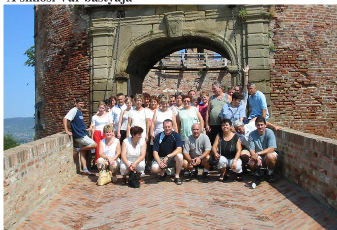
A kirándulók csoportja a bástyánál