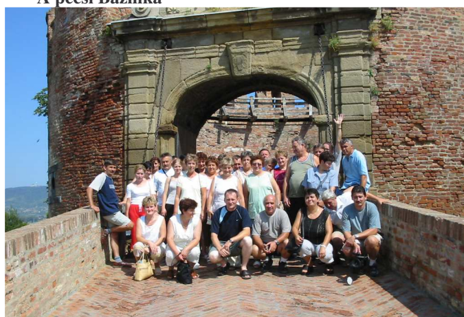
Csoportkép a siklósi Vár bejáratánál