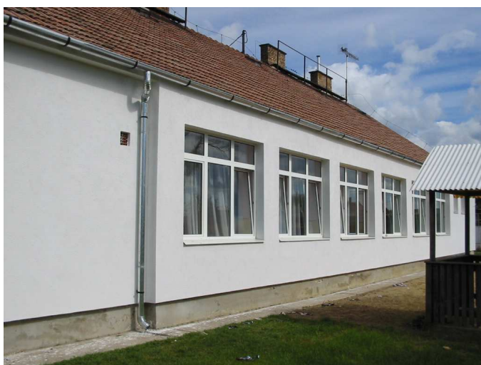
Az óvoda külső látkepe a felújítás után