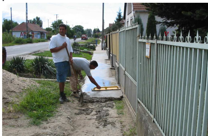
Járdafelújítás a Kossuth utcán

A temető útjainak burkolata is elkészült, ezek után a járdák felújítása következett amellyel szintén jó ütemben haladunk.