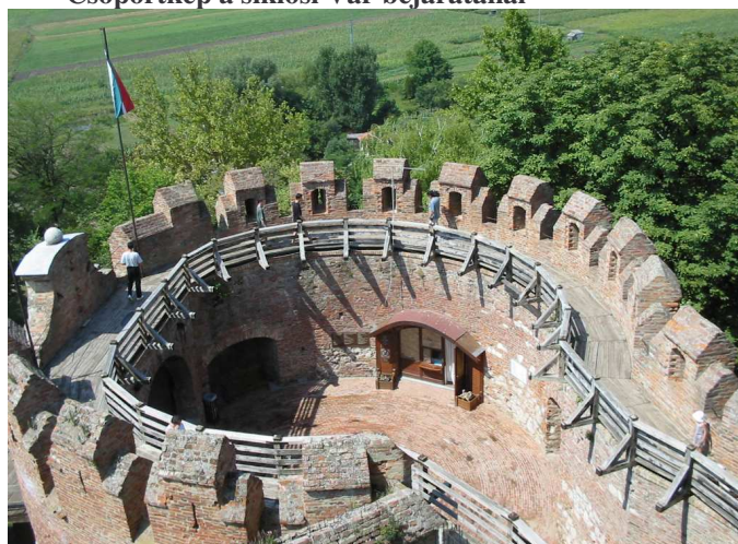
A siklósi Vár bástyája