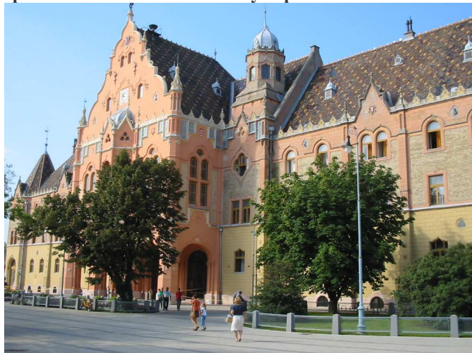
A kecskeméti városháza

Szinte már hagyománynak számít, hogy az Önkormányzat a dolgozóit kirándulásra viszi. Nem titkolt cél, hogy a pihenés és az élményszerzés mellett a dolgozók összekovácsolása, egymás jobb megismerése is célja az Önkormányzat vezetőinek. Ez évben hosszabb lélegzetű utat terveztünk, amely Kecskemét városi sétája után Pécs és környékének, így Siklós és Harkány környékének felfedezése. A három napos úton rengeteg élményben volt részünk, nagyon sok szép látvánnyal, élménnyel gazdagodva tértünk haza. Ezekről a gyönyörű tájakról épületekről adunk közre néhány képet.