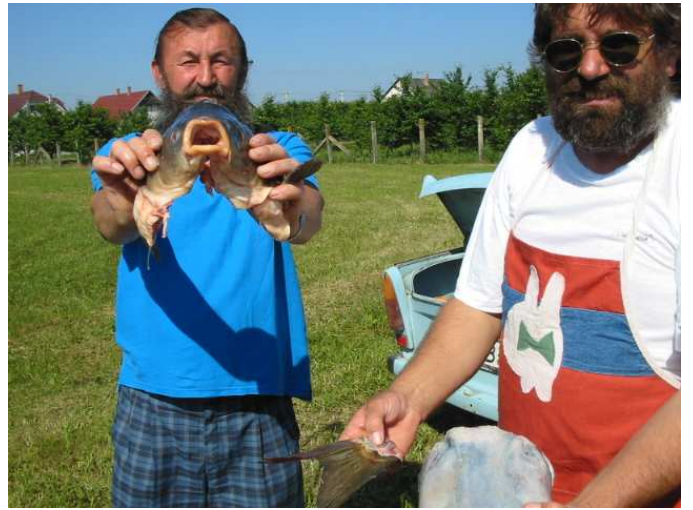
A „Szakálasok” és az alapanyag