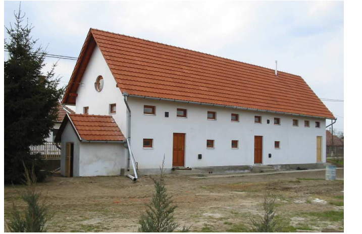
Az Ifjúsági szálláshely udvari homlokzata.