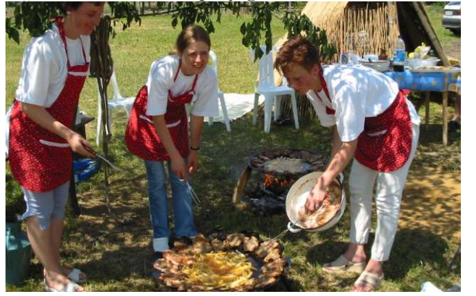
A hivatal dolgozói tárcsán sütik a húst