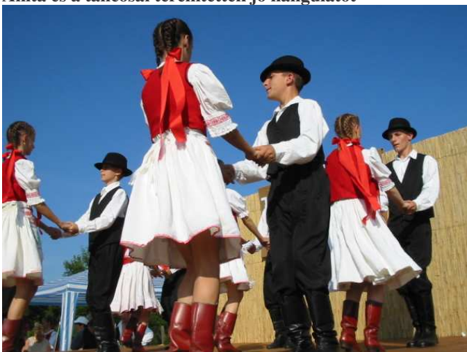
Az Ökörítőfülpösi „FERGETEGES” Táncegyesület táncaival kápráztatta el a közönséget.