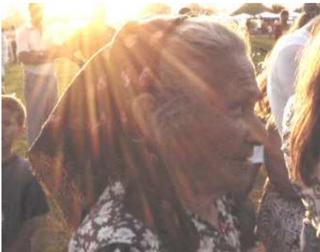
Jól érezte magát az idősebb korosztály...