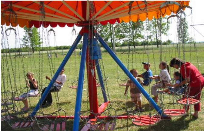
A kicsik is megtalálták a szórakozásukat