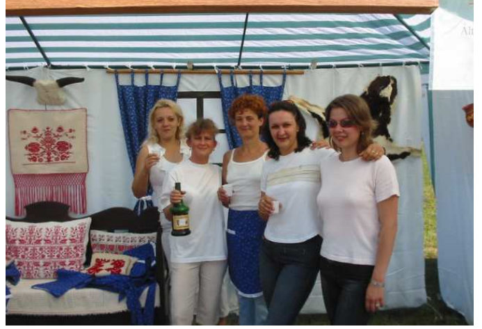
A tanárok készülődnek a főzéshez