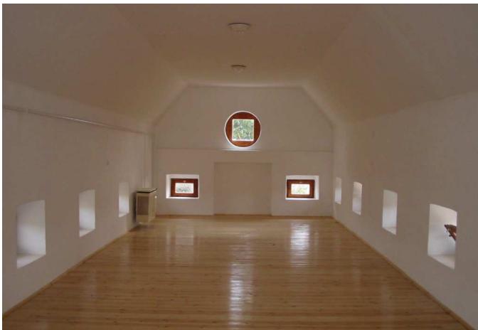
Az Ifjúsági szálláshely felső szintje