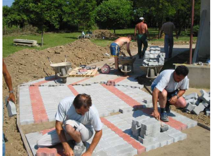
A ravatalozó környéke igényes burkolatot kap.

Egy közösségről, településről nagyon sokat elárul, hogy az ősök örökös nyughelyét, a sírkertet hogyan gondozza, milyen állapotban tartja. Az Ország településeit járva, egyre inkább fellelhető a holtak iránti tisztelet, kegyelet, amely a temetők rendezettségében, ápoltságában is kifejezésre jut. Győrteleken is mindig fontos szempont volt a temetők rendben tartása