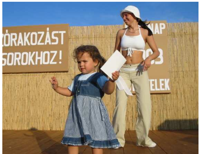
... és a fiatal egyaránt