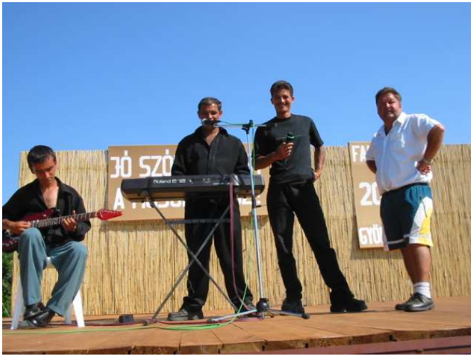
Serbán & társai egész napos élőzenét szolgáltatnak