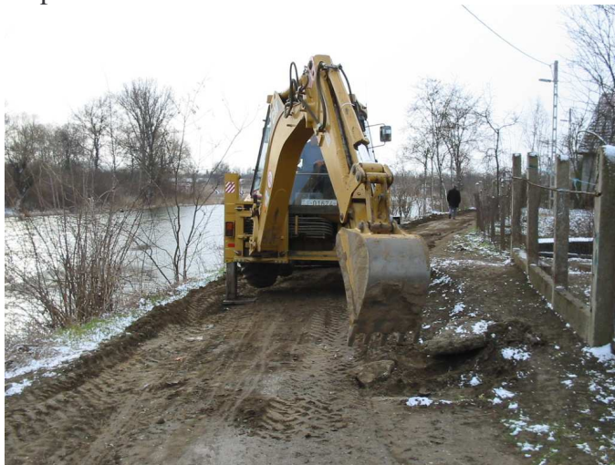
Az erógép megkezdte az útalap kialakítását.

A „jó idő” beálltával megérkezett a Kristályvíz KHT Mátészalka, mint kivitelező munkagépe. Az Önkormányzat közmunkásainak segítségével megkezdtek a Rákóczi utca útalapjának kiépítését.