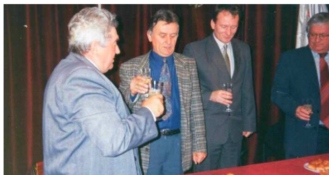
.... és a gratulációk fogadása.