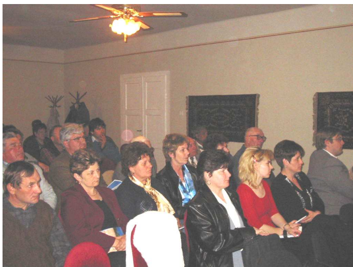
A résztvevők egy csoportja.