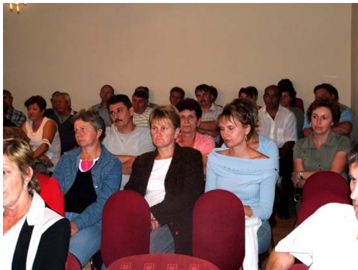
A résztvevők egy csoportja

Újra eltelt 4 esztendő. Eltelt egy ciklus az Önkormányzat, a település életében. Szeptember 25-én, a polgármester és a képviselő-testület számot adott az elmúlt évek munkájáról, értékelte az elmúlt ciklus teljesítményét. A kötelező feladatok végrehajtását jónak értékelte, hisz az időben, rendben, a tervezett szinten valósult meg. Folyamatosan dolgozott az Önkormányzat a közlekedés biztonságossá tételén. Egyéb források hiányában a járdák felújítását, önkormányzati utak karbantartását, sárrázók burkolatának felújítását az Önkormányzat saját erőből valósította meg. Ezek közé tartoznak a Kossuth utcai Szabolcsi Építők utcai járdák teljes felújítása, ideiglenes járda kialakítása. Fontos feladatnak tekintette az Önkormányzat a falu külső megjelenésének formálását, szépítését. Ennek érdekében a kisállomásnál és a kisiskolánál parkot épített, új buszvárókat, szeméttartókat, virágos ládákat helyezett el a község területén. 2005-ben új polgármesteri hivatal épült, ez évben megvalósul a Művelődési