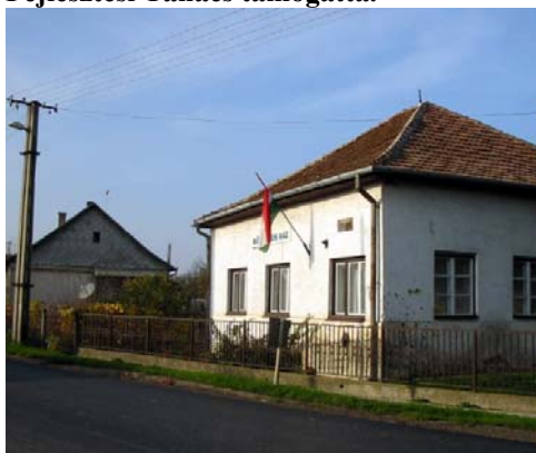
A Műv. Ház eredeti formája

A felújítást a Sz – Sz – B Megyei Fejlesztési Tanács támogatta.